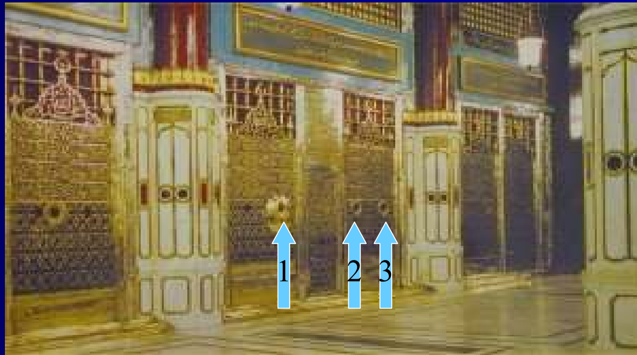
1. Maqam Rasul 2. Maqam Saiyidana Abubakar 3. Maqam Saiyidina Omar